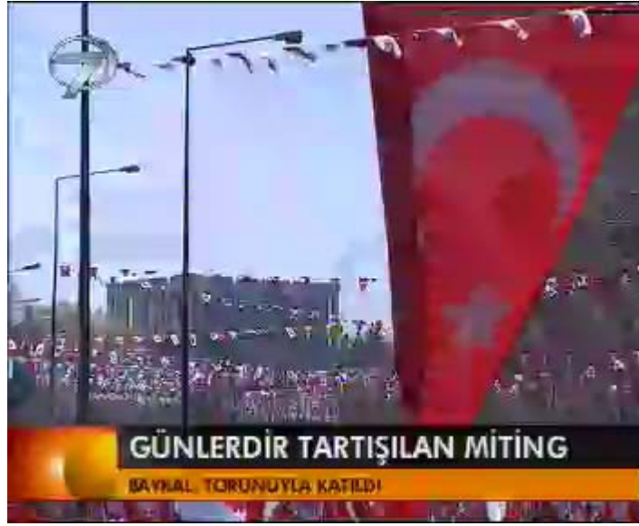
F 10 Kanal 7 miting haberinden uzak çekim örneği