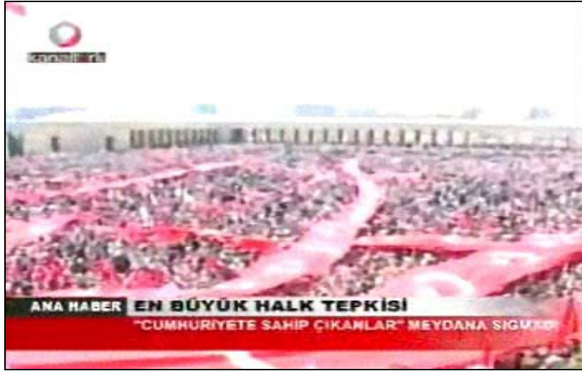
F 2 Kanaltürk miting haberinden geniş açılı çekim örneği