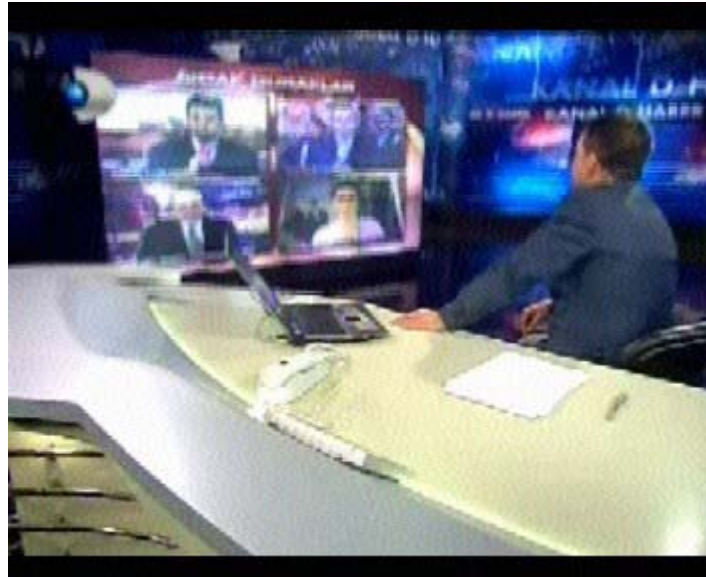
F 11 Kanal D miting haberinde stüdyo görünümü