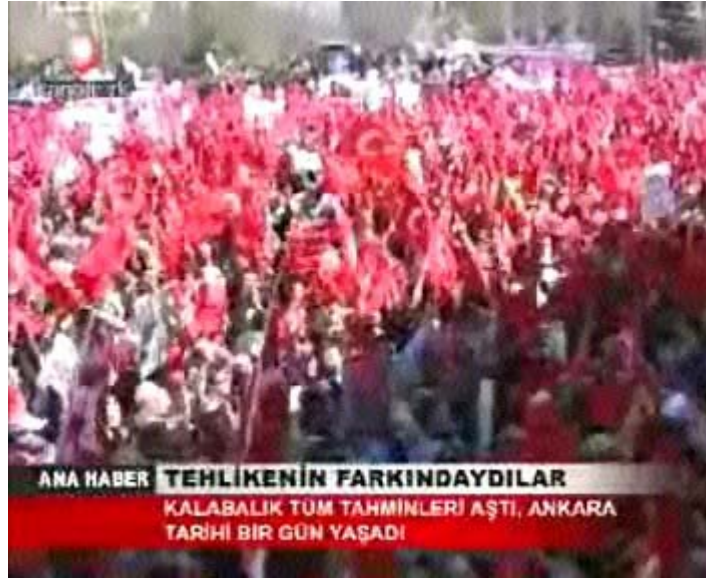
F16 Kanaltürk miting haberinde genel çekim örneği