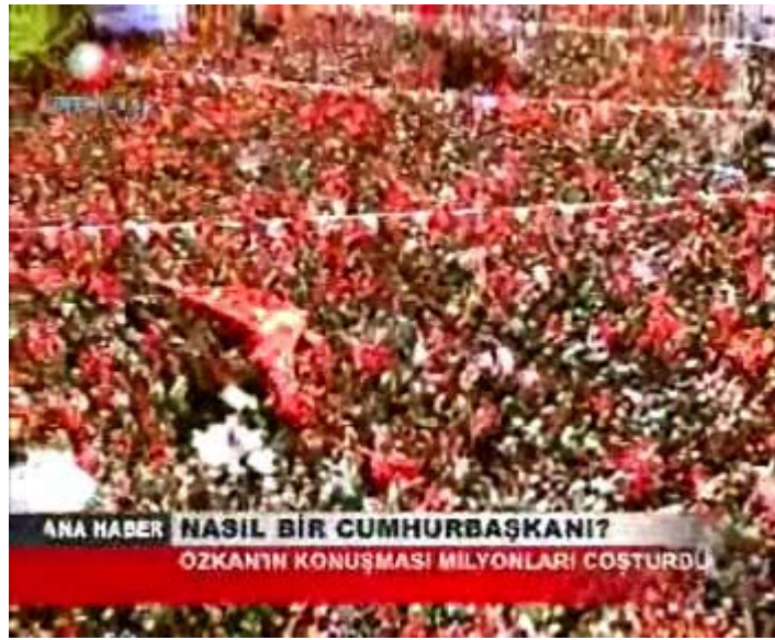
F 17 Kanaltürk miting haberinde genel çekim örneği

“Milyonlar Anıtkabir’e aktı, sabahın ilk saatlerinden başlayarak ellerinde Türk bayrakları, Ata’nın mozolesine gitti...”