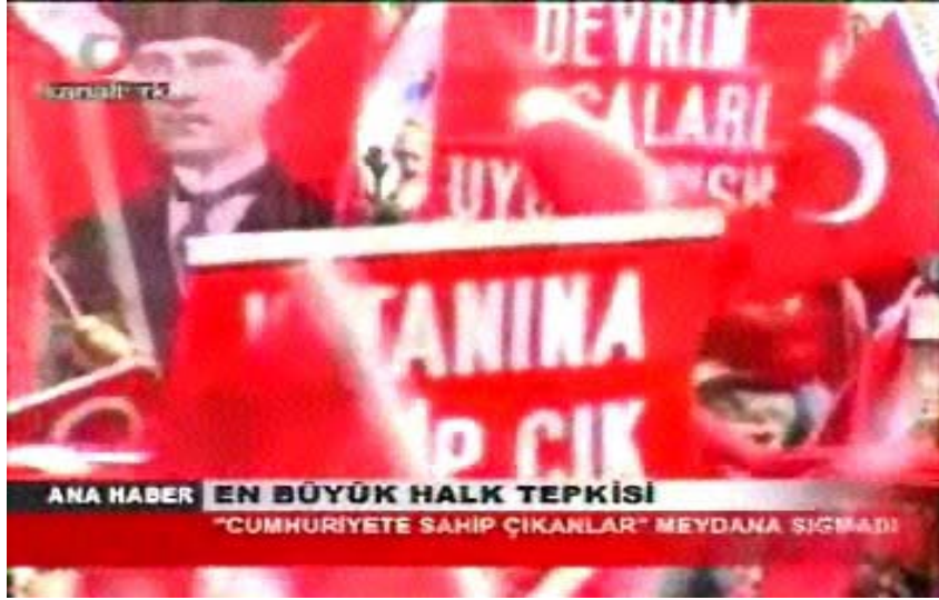
F 4 Kanaltürk miting haberinden pankart çekimi örneği