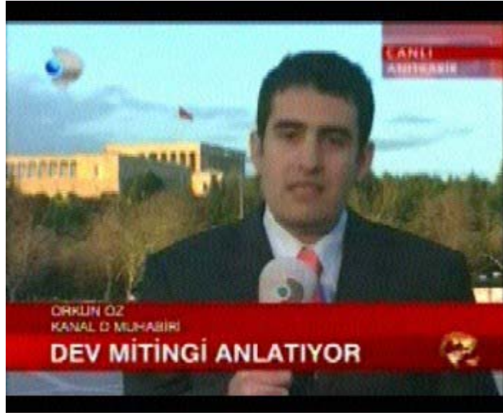
F 12 Kanal D miting haberinde olay yerinden sunum