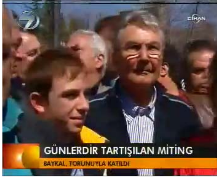
F 5 Kanal 7 miting haberinden yakın çekim örneği

Kanal 7 televizyonunun konuyla ilgili haberin giriş bölümünden sonra verilen görsel malzeme, Kanaltürk haber bülteninde bir saate yakın süreyle yayınlanan, miting alanını ve topluluğu bütünüyle gösteren geniş açılı çekimlerin aksine, bütünden ayıklanmış ya da dar açılı-yakın çekimlerden, ya da insanların seçilemediği oldukça uzak çekimlerden oluşmaktadır. Öyle ki haberdeki ilk görsel malzemedede, kameranın konumu nedeniyle Tandoğan Meydanı'nda oldukça uzakta görünen konuşma platformunda boylu boyunca yer alan büyük Atatürk fotoğrafı izleyici tarafından seçilememektedir. Haber izleyicisi, üst açıyla çekilen bu görüntüde ellerinde bayraklar taşıyan yurttaşları sırtları kameraya dönük konumda ve yalnızca en arka sıralardakilerin kafalarını, önlere doğru ise insanları değil yalnızca bayrakları görebilmektedir. Haber metni içinde olay sırasında pankartlar taşındığından söz edildiğinde bile seçilen görüntüde pankartlar okunmayacak uzaklıktadır.