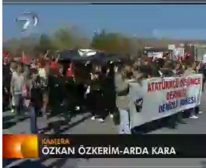
F 9 Kanal 7 miting haberinden pankart örneği

Görüntüler arasında dört kişinin taşıdığı “ATATÜRKÇÜ DÜŞÜNCE DERNEĞİ, DENİZLİ ŞUBESİ” yazılı bir bez afiş ve arkasından gelen 40-50 kişi vardır. Sabahın erken saatlerinde çekildiği için alandaki kalabalık hakkında fikir vermeyen bu görüntü aynı zamanda mitingi düzenleyen tek kuruluş olarak gösterilmeye çalışılan ADD'ye de işaret etmektedir. “Atatürkçü Düşünce Derneği'nin öncülük ettiği Cumhuriyet Mitingi adı verilen Miting Ankara Tandoğan'da yapıldı” diyen üst ses görüntünün algılanışını pekiştirir.