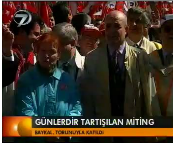
F 8 Kanal 7 miting haberinden yakın çekim örneği

“Televizyon ekranının küçük olması, çevrenin gösterilmesini engeller, çevre unsurunun etkisini azaltır, hatta etkisiz hale getirir. Anlaşıldığı gibi, bireyleri ve nesnelere çevresinden soyutlayan yakın çekim, televizyonun asıl çekim ölçeği olarak karakterize edilmektedir. Bu fiziksel gerekçeli indirgeme, yakın çekimin sinemasal saymacalardan aktarılan anlamıyla da birleşerek, televizyonun kişisel bir dünya olduğunu ileri süren ideolojiye dönüşmektedir. Bu iddia, bireyin ancak toplumsal çevreyle varolabileceği .gerçeğini göz ardı etmektedir.” 1