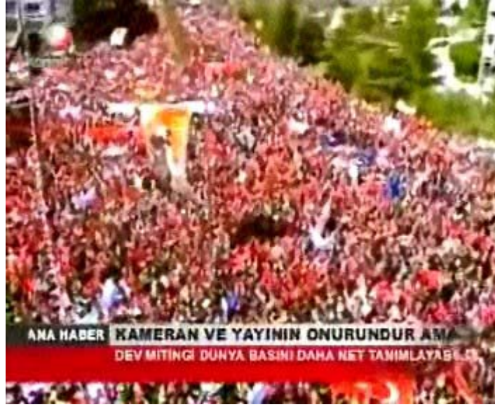
F 14 Kanaltürk miting haberinde genel çekim örneği