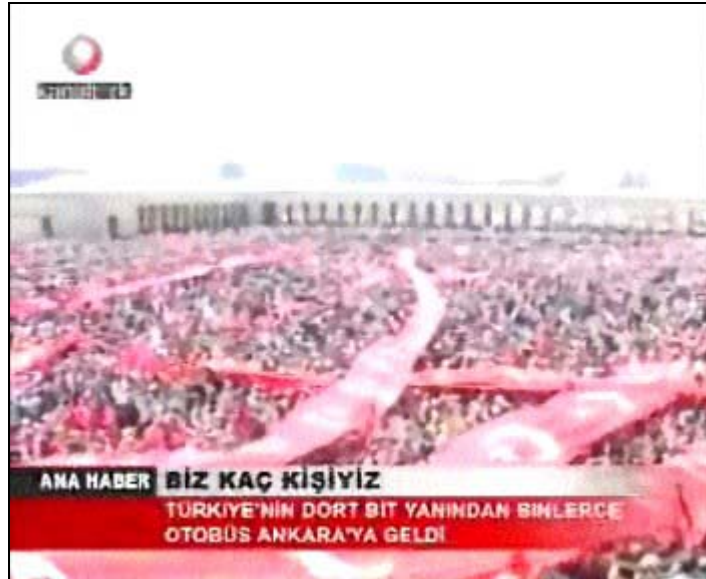
F 15 Kanaltürk miting haberinde genel çekim örneği

“... Sahi gördünüz mü, kaç kişiyiz biz?”