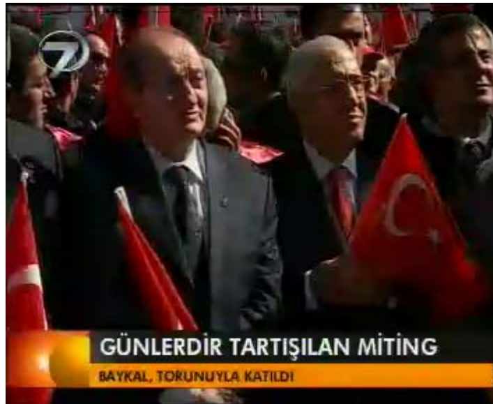
F 7 Kanal 7 miting haberinden yakın çekim örneği

Miting katılımcısı yurttaşlarla ropörtajlara kesinlike yer verilmemiş, haberin söylemi ‘şaiBELİ’ geçmişe sahip olan Şener Eruygur’un başkanlığını yaptığı derneğin düzenlediği, çeşitli konuşmalar ve konserlerin yapıldığı, olaysız dağılan bir miting bağlamında kapanmıştır. Net genel çekimlerin yerine dar açılı yakın çekimlerin yeğlendiği haber kurgusunda ADD Genel Başkanı Şener Eruygur, Ankara Üniversitesi Rektörü Nusret Aras, CHP Genel Başkanı Deniz Baykal’ın yakın çekimlerine yer verilmiştir.