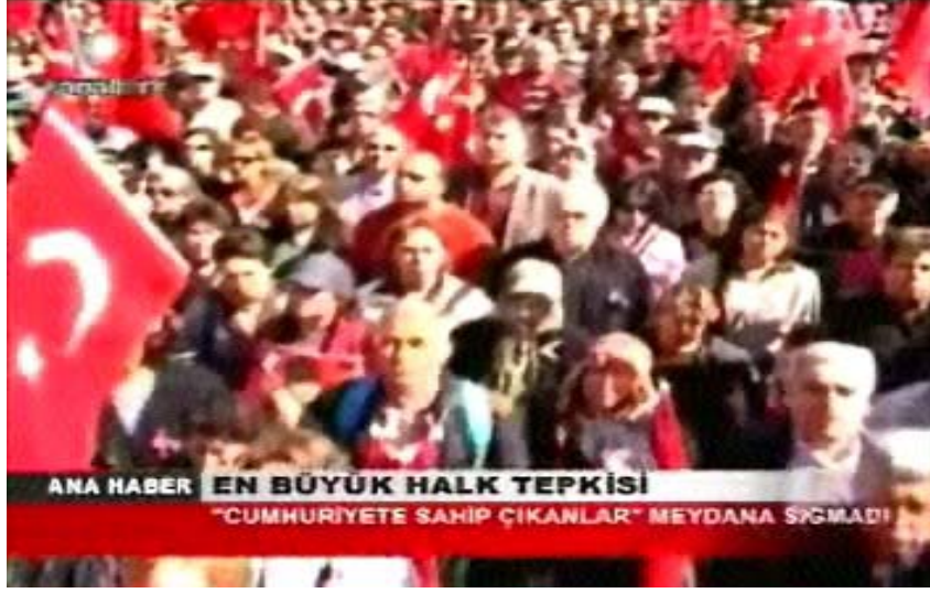
F 3 Kanaltürk miting haberinden geniş açılı çekim örneği