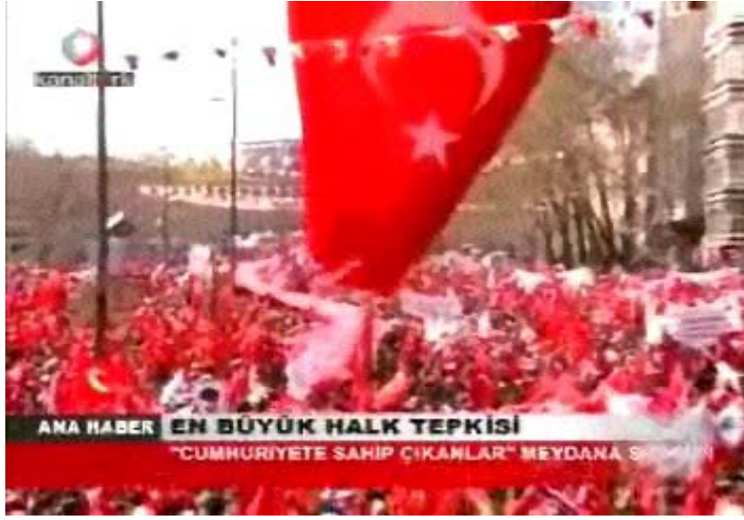
F 1 Kanaltürk miting haberinden geniş açılı çekim örneği