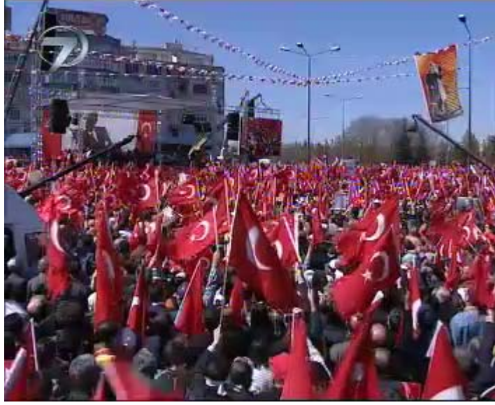
F 6 Kanal 7 miting haberinden uzak çekim örneği

Miting katılımcısı yurttaşlarla ropörtajlara kesinlike yer verilmemiş, haberin söylemi ‘şaiBELİ’ geçmişe sahip olan Şener Eruygur’un başkanlığını yaptığı derneğin düzenlediği, çeşitli konuşmalar ve konserlerin yapıldığı, olaysız dağılan bir miting bağlamında kapanmıştır. Net genel çekimlerin yerine dar açılı yakın çekimlerin yeğlendiği haber kurgusunda ADD Genel Başkanı Şener Eruygur, Ankara Üniversitesi Rektörü Nusret Aras, CHP Genel Başkanı Deniz Baykal’ın yakın çekimlerine yer verilmiştir.