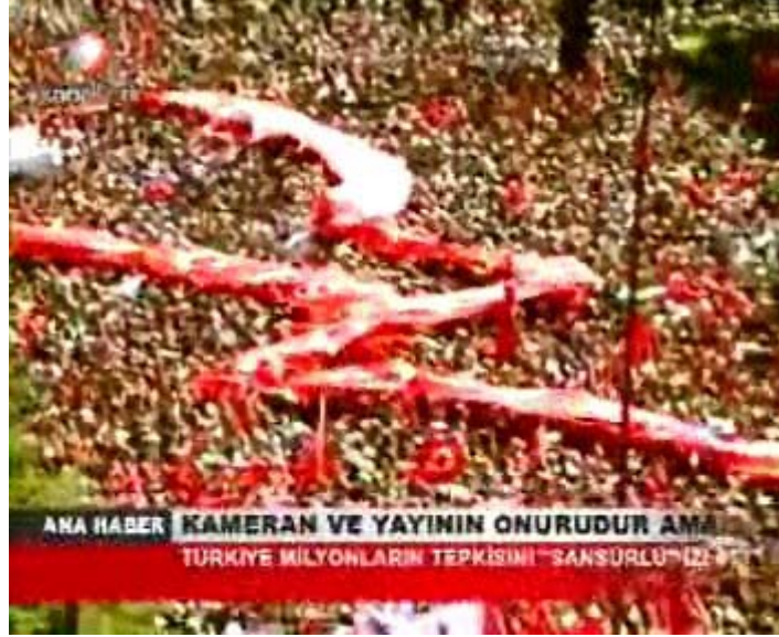
F 13 Kanaltürk miting haberinde genel çekim örneği

kullandığı çok sayıda genel ve uzak çekimlerle dayanak noktası oluşturmaya çalışmıştır. Miting katılımcılarına “gelincikler” adı verilmesi de, onların ortak bir toplumsal bilinç etrafında eyleme geçtiklerini vurgulama amacının göstergesi konumundadır.